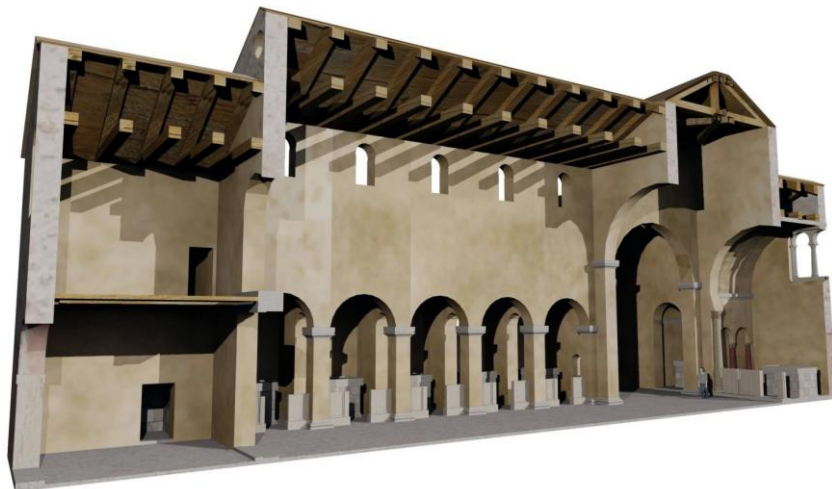
San Salvador de Oviedo: hipótesis de reconstrucción, según Martín Andreu Valdés Solís.